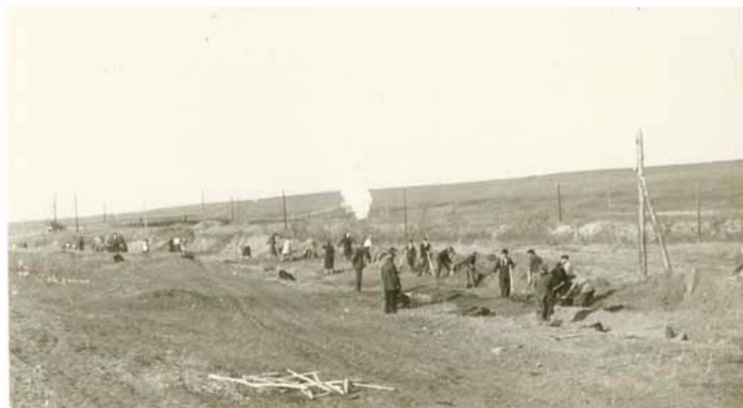
Рытье траншеи для газопровода «Елшанка – Саратовская ГРЭС». 1942 г.