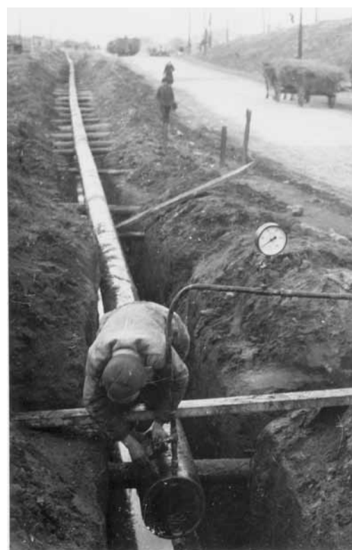
Подготовка к опробованию газопровода «Елшанка – Саратовская ГРЭС». 1942 г.