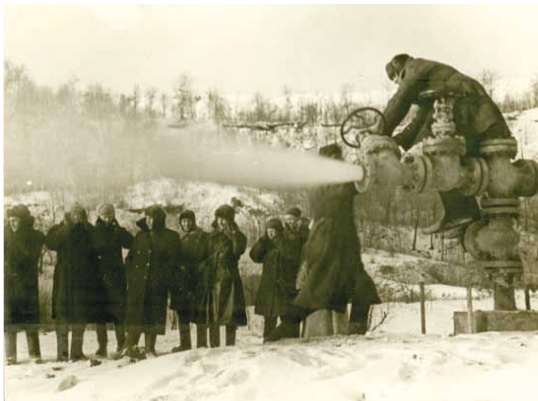
Продувка скважины. Елшанка. 1942 г.

28 октября 1942 года «в котельной городской электростанции отдавались последние распоряжения. Дежурный инже-