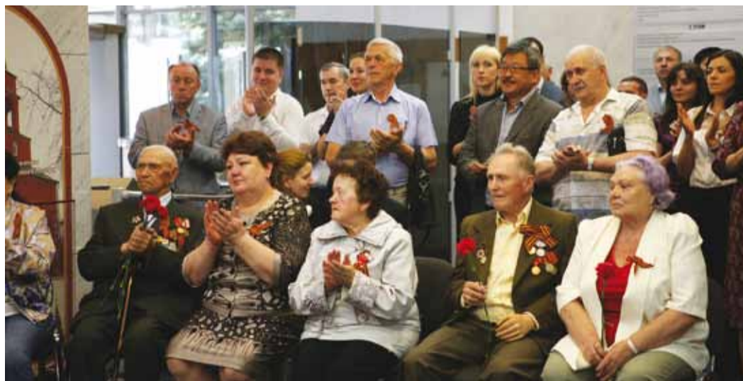
Великие события вызвали искренние чувства у зрителей и гостей