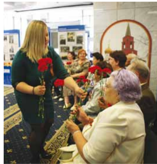
Алые гвоздики - символ Великой Победы