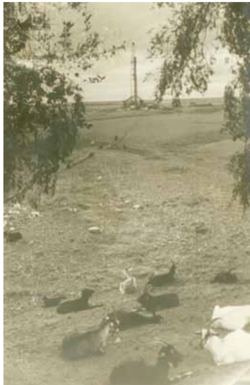
В Елшанке перед началом работ. 1941 г.

История ООО «Газпром трансгаз Саратов» неразрывно связана с Великой Отечественной войной. Ведь первое в Поволжье газовое месторождение, разработка которого стала поворотным событием в поиске и освоении газовых месторождений не только в Саратовской области, но и на всей территории Советского Союза, было открыто в районе села Елшанка 28 октября 1941 года.