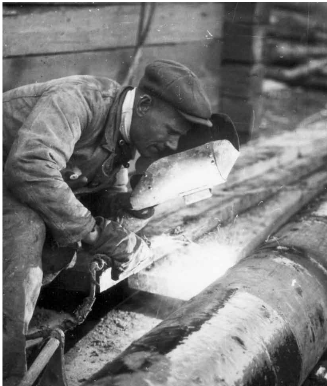
Сварка труб газопровода «Елшанка – Саратовская ГРЭС». 1942 г.