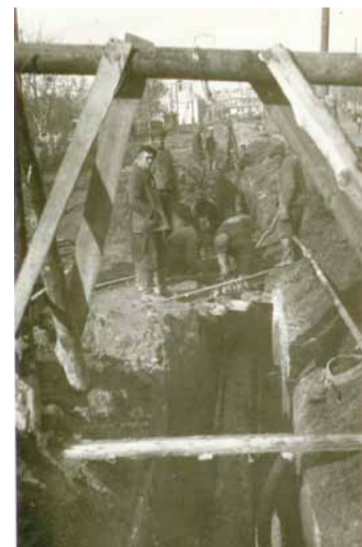
Прокладка труб газопровода «Елшанка – Саратовская ГРЭС» по улицам г. Саратова. 1942 г.