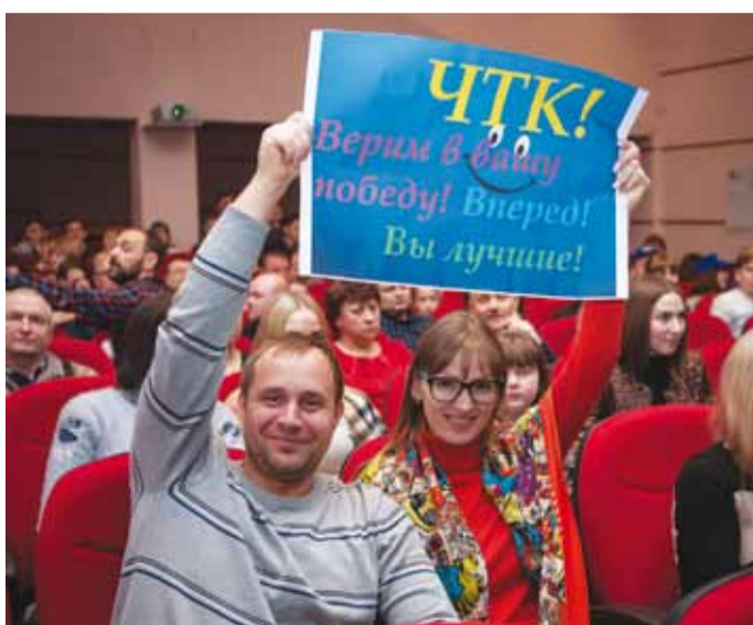
Более 200 человек пришли поддержать любимых кавээнщиков