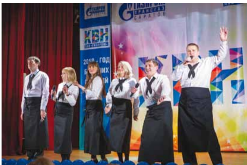
С первых минут дебютант КВН - команда «ГПИ» зарядила зал искрометными шутками