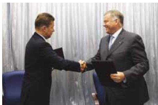
Алексей Миллер и Владимир Якунин

21 июня в рамках Петербургского международного экономического форума — 2013 Председатель Правления ОАО «Газпром» Алексей Миллер и Президент ОАО «Российские железные дороги» (ОАО «РЖД») Владимир Якунин подписали Меморандум о сотрудничестве в области использования газомоторного топлива. Документ подписан с целью внедрения газомоторного топлива на железнодорожном транспорте, что позволит снизить себестоимость перевозок за счет топливной составляющей и сократить негативное влияние на окружающую среду.