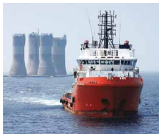
«Газпром» и Shell рассмотрели возможность совместной деятельности в рамках освоения Арктического шельфа Российской Федерации

11 июля состоялась рабочая встреча Председателя Правления Алексея Миллера и Главного исполнительного директора Shell Питера Возера, в ходе которой стороны обсудили основные вопросы двустороннего сотрудничества в нефтегазовой сфере, включая взаимодействие в области разведки, добычи, переработки, производства СПГ и реализации нефти и газа на мировом рынке энергоресурсов.