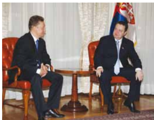
Алексей Миллер и Ивица Дачич

27 марта состоялся визит делегации ОАО «Газпром» во главе с Председателем Правления Алексеем Миллером в Республику Сербию, в ходе которой состоялась рабочая встреча с Президентом Республики Томиславом Николичем и премьер-министром Ивицей Дачичем. В присутствии премьер-министра подписан долгосрочный контракт на поставку российского газа в Республику Сербию в объеме до 1,5 млрд куб. м газа ежегодно в течение 10 лет.