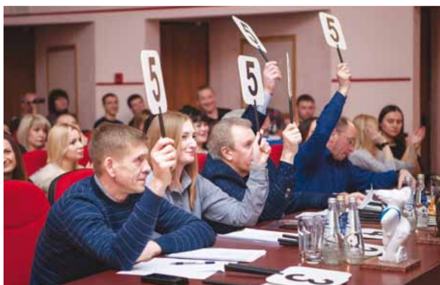
Члены жюри по достоинству оценили игру всех команд