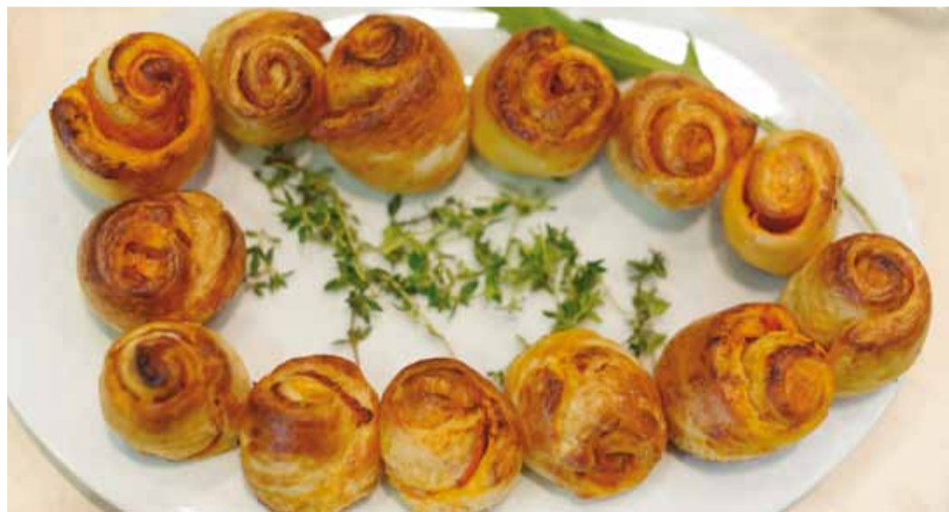
На такое угощение в холодный зимний день организм ответит вам теплом

В своей работе сотрудники филиала используют сборники рецептов, разработанные ведущими институтами питания стра-