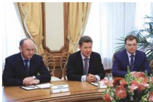
Алексей Миллер (в центре) во время встречи

13 июня в центральном офисе ОАО «Газпром» Председатель Правления Алексей Миллер и Министр РФ по развитию Дальнего Востока, полномочный представитель Президента РФ в Дальневосточном федеральном округе Виктор Ишаев подписали Соглашение о сотрудничестве, главной целью которого является обеспечение благоприятных условий для социально-экономического развития Дальневосточного федерального округа (ДФО) и реализации Восточной газовой программы.