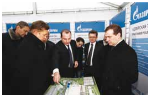
Алексей Миллер и Дмитрий Медведев на Адлерской ТЭС

21 января введена в эксплуатацию Адлерская ТЭС — самый современный объект энергогенерации Сочи. В мероприятиях приняли участие Председатель Правительства РФ Дмитрий Медведев и Председатель Правления ОАО «Газпром» Алексей Миллер.