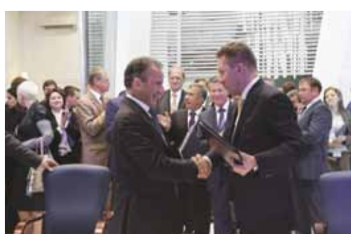
Анри Проглио и Алексей Миллер

21 июня в рамках Петербургского международного экономического форума — 2013 состоялась встреча Председателя Правления ОАО «Газпром» Алексея Миллера и Президента, главного исполнительного директора компании EDF (одного из лидеров энергетического рынка Европы) Анри Проглио. По итогам встречи стороны подписали Основные условия контракта на поставку газа компании EDF в рамках проекта «Южный поток».