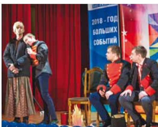
«Сторожилы», «На связи» и «Угарный газ» повеселили публику музыкальными домашними заданиями