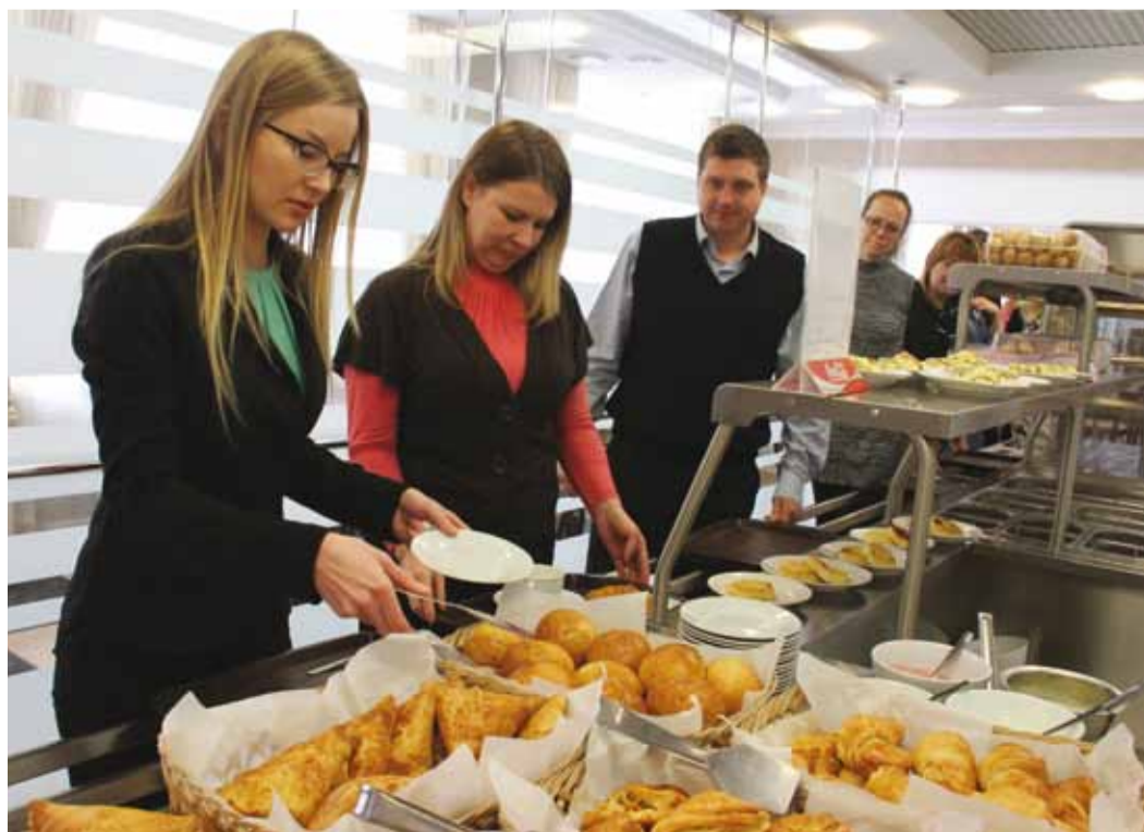
Натуральную и вкусную выпечку любят все!

«Полноценное и обогащенное витаминами и микроэлементами питание способствует повышению сопротивляемости организма к инфекциям, что наиболее важно в период эпидемического сезона заболеваемости гриппом и ОРВИ. Содержащиеся в хлебе натуральные дрожжи и клетчатка помогают улучшить пищеварение, особенно у лиц страдающих различными заболеваниями желудочно-кишечного тракта и максимально усваивать питательные вещества».