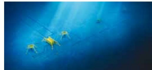
Подводный добычный комплекс Киринского месторождения

23 октября на Киринском месторождении проекта «Сахалин-3» успешно испытан первый в России подводный добычный комплекс.