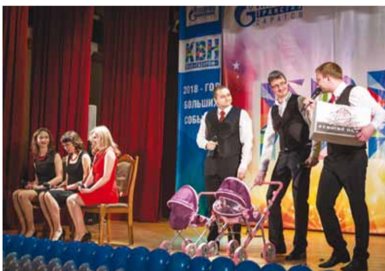
Ребята из «Голливуда» рассказали, кто должен сидеть с детьми, пока мама поет с подругами в караоке