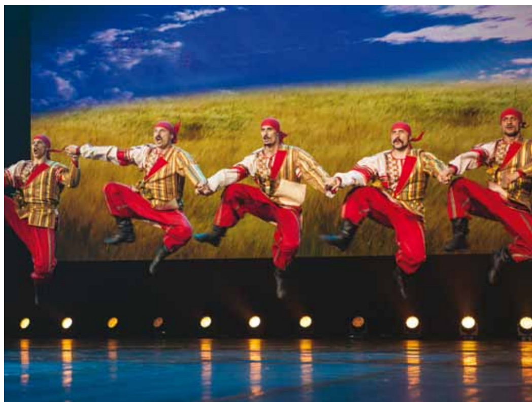
■ Специальным гостем фестиваля стал всемирно известный Государственный академический Кубанский казачий хор