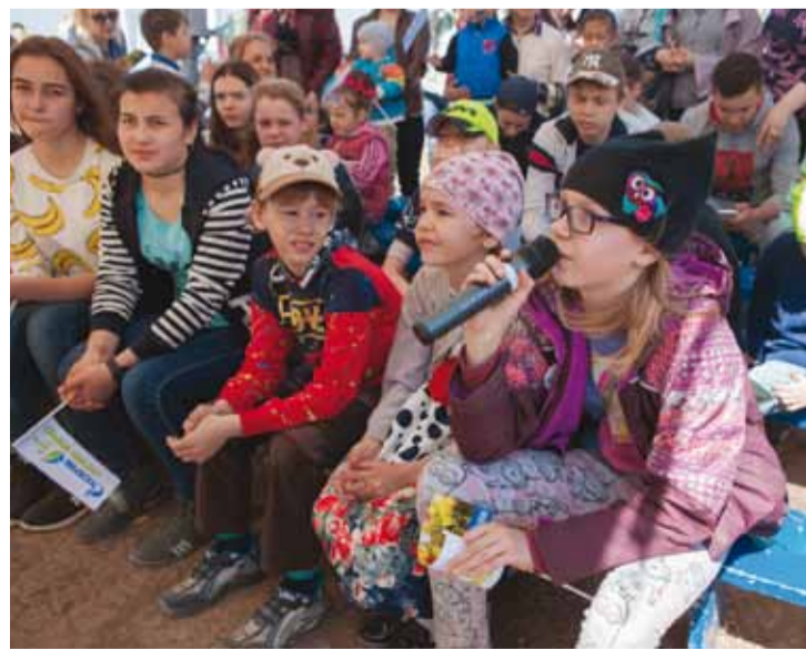
Гостей Экологической станции ждали тематические викторины