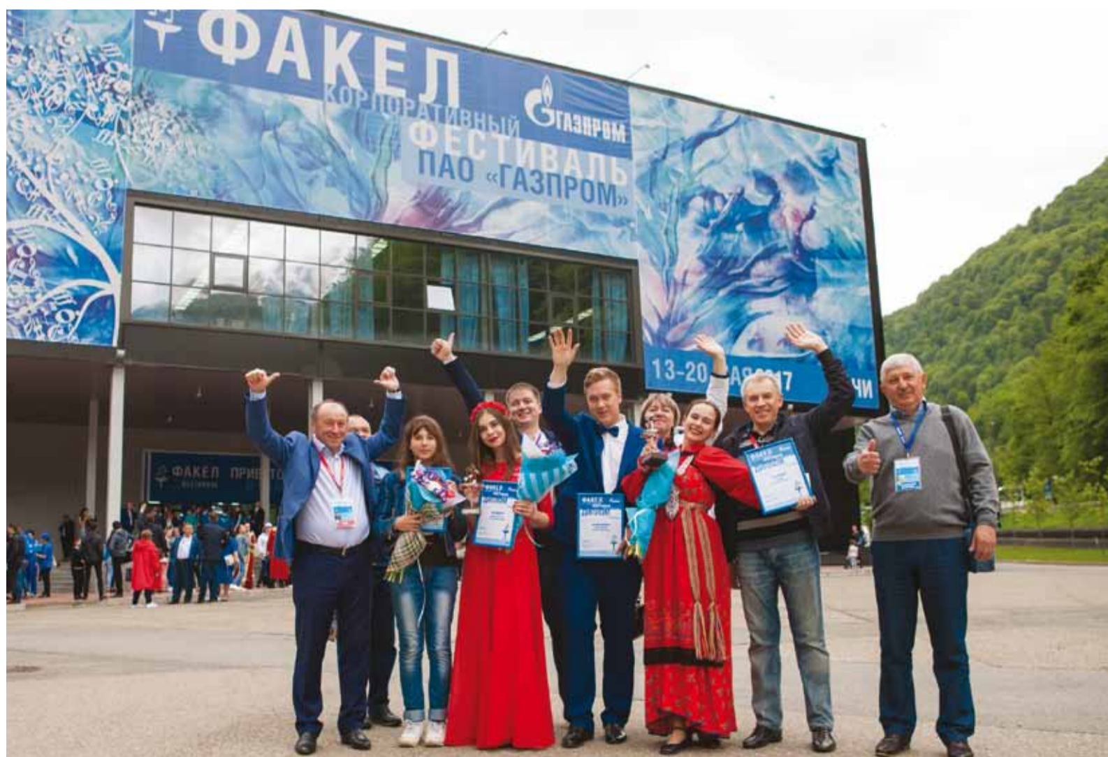
Счастливые и довольные результатом участники нашей делегации

С 13 по 20 мая в Сочи (Красная поляна) прошел заключительный тур VII корпоративного фестиваля «Факел» самодельных творческих коллективов и исполнителей дочерних обществ и организаций ПАО «Газпром». Помимо делегации нашего предприятия за звание лауреатов боролись участники из 40 дочерних обществ России, Армении, Беларуси, Китая, Кыргызстана. Кроме того, в этом году на фестиваль приехали партнеры группы «Газпром» из Боливии, Вьетнама, Словении, Германии и Франции. А оценивали выступления коллективов известные деятели искусства и культуры РФ.