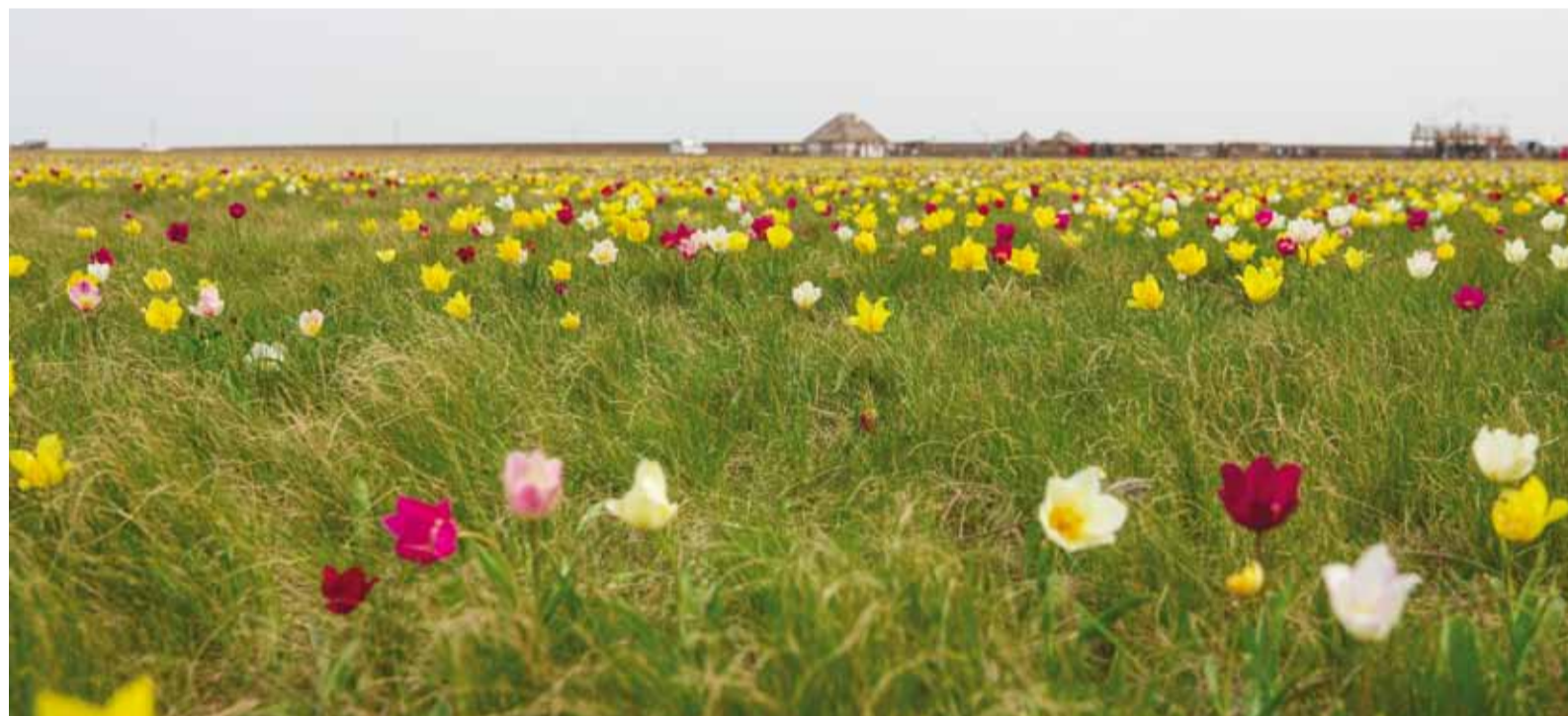
Куриловская степь - особо охраняемый природный памятник