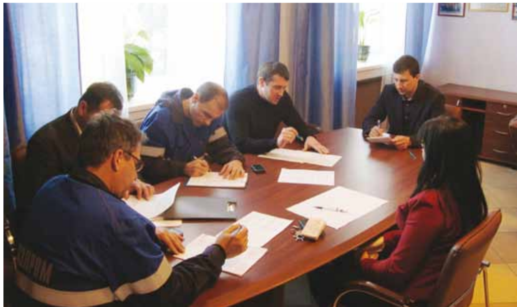
Рабочее совещание в УАВР

ритетов и совершенствования профилактических программ, реализуемых на уровне филиала.