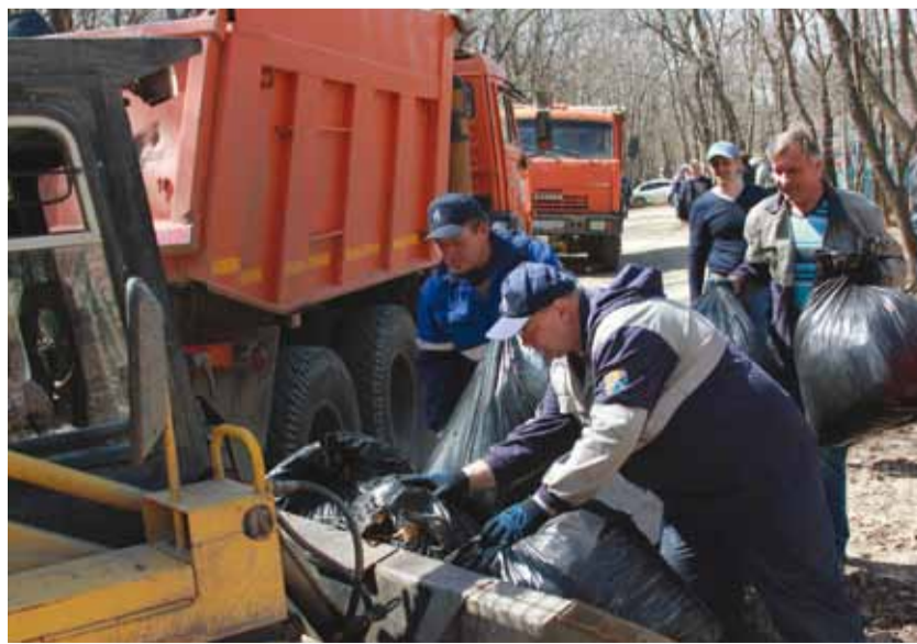
Во Всероссийском субботнике приняли участие более 650 работников нашего общества