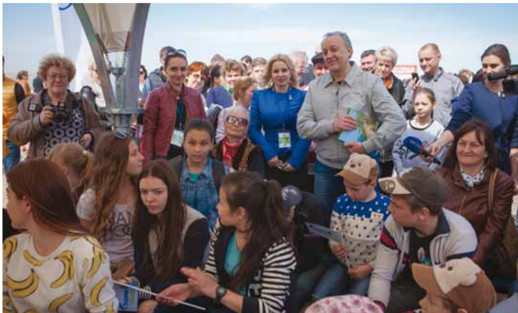
Экологическую станцию общества посетил врио губернатора Валерий Радаев

Гостями экологической станции нашего общества стали в тот день и многие взрослые, в числе которых был врио Губернатора