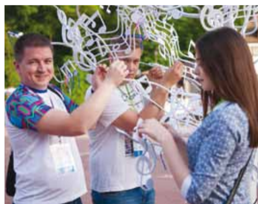
Загадав желание, повязываем цветные ниточки на Дерево Дружбы