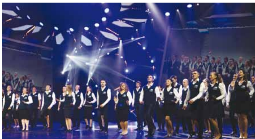
Кураторы фестиваля, которые всю неделю были рядом с участниками, подготовили заключительный номер для своих гостей