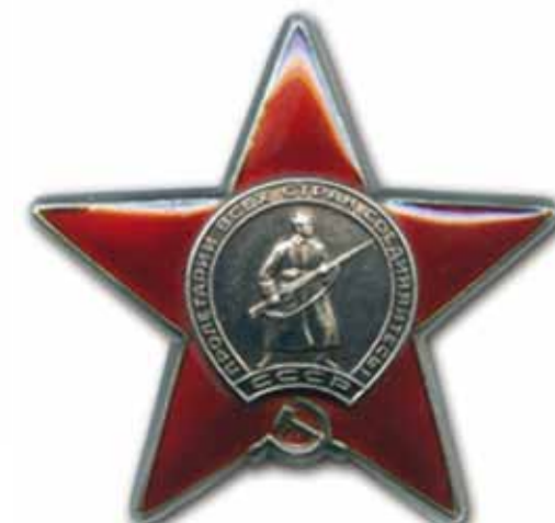
Орден «Красной звезды» (1930 г.) - самая популярная награда за боевые подвиги