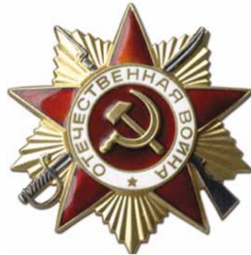
Первая боевая награда – орден Отечественной войны

Кроме того, в феврале 1943 г. Президиум Верховного Совета СССР учредил медаль под названием «Партизану Отечествен-