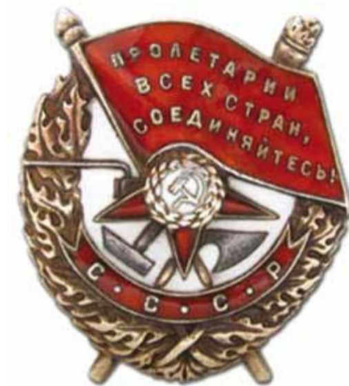
Орден «Боевого Красного знамени», утвержденный в 1918 году - одна из распространенных наград Великой Отечественной войны