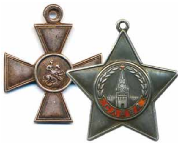
Орден Славы по праву можно назвать преемником главной солдатской награды России – Георгиевского креста