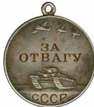
Медаль «За отвагу», учрежденная в 1938 году, была особо уважаемой и ценной среди фронтовиков: ею награждали исключительно за личную храбрость, проявленную в бою