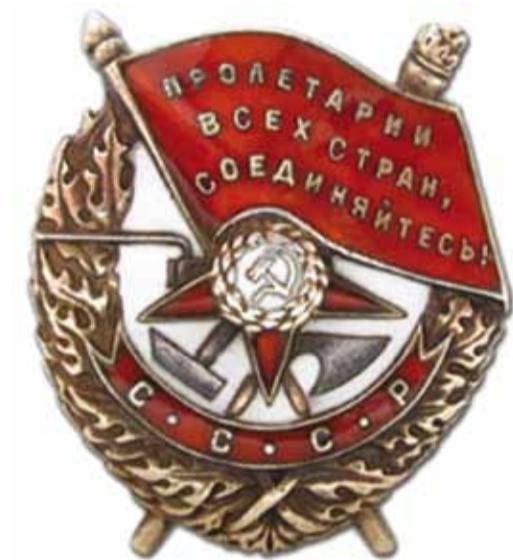
Орден «Боевого Красного знамени», утвержденный в 1918 году - одна из распространенных наград Великой Отечественной войны