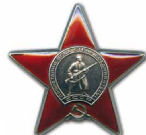
Орден «Красной звезды» (1930 г.) - самая популярная награда за боевые подвиги