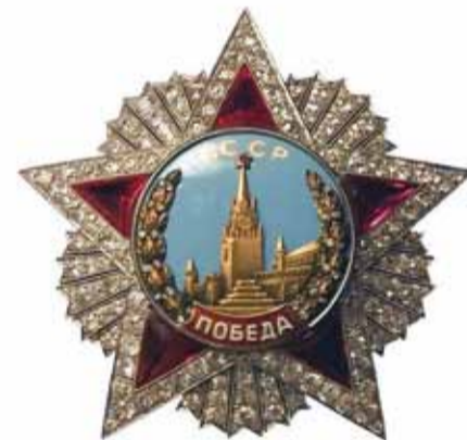
Всего 17 кавалеров были удостоены высшей военной награды – ордена «Победа»