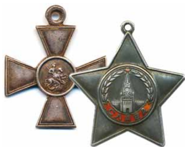
Орден Славы по праву можно назвать преемником главной солдатской награды России – Георгиевского креста