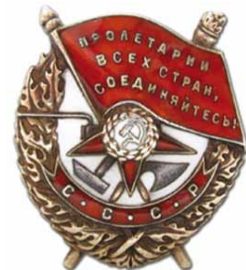
Орден «Боевого Красного знамени», утвержденный в 1918 году - одна из распространенных наград Великой Отечественной войны