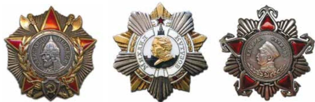
Ордена в честь великих русских полководцев: Александра Невского, Михаила Кутузова, Павла Нахимова

Тенденция восстановления традиций славной русской воинской истории нашла свое продолжение в учреждении в 1943