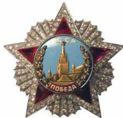
Всего 17 кавалеров были удостоены высшей военной награды – ордена «Победа»