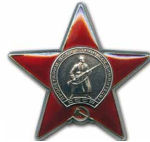
Орден «Красной звезды» (1930 г.) - самая популярная награда за боевые подвиги