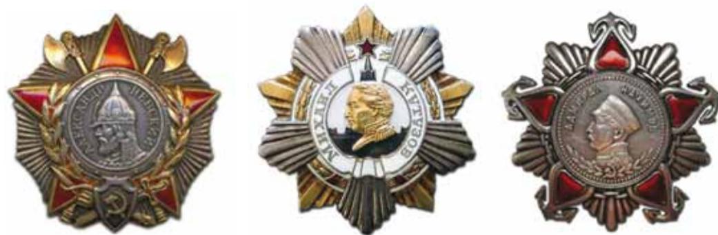
Ордена в честь великих русских полководцев: Александра Невского, Михаила Кутузова, Павла Нахимова

Тенденция восстановления традиций славной русской воинской истории нашла свое продолжение в учреждении в 1943