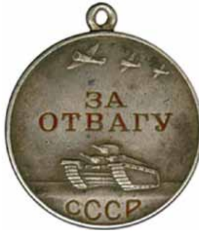
Медаль «За отвагу», учрежденная в 1938 году, была особо уважаемой и ценной среди фронтовиков: ею награждали исключительно за личную храбрость, проявленную в бою