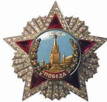
Всего 17 кавалеров были удостоены высшей военной награды – ордена «Победа»