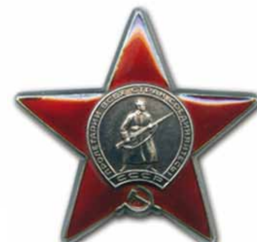
Орден «Красной звезды» (1930 г.) - самая популярная награда за боевые подвиги