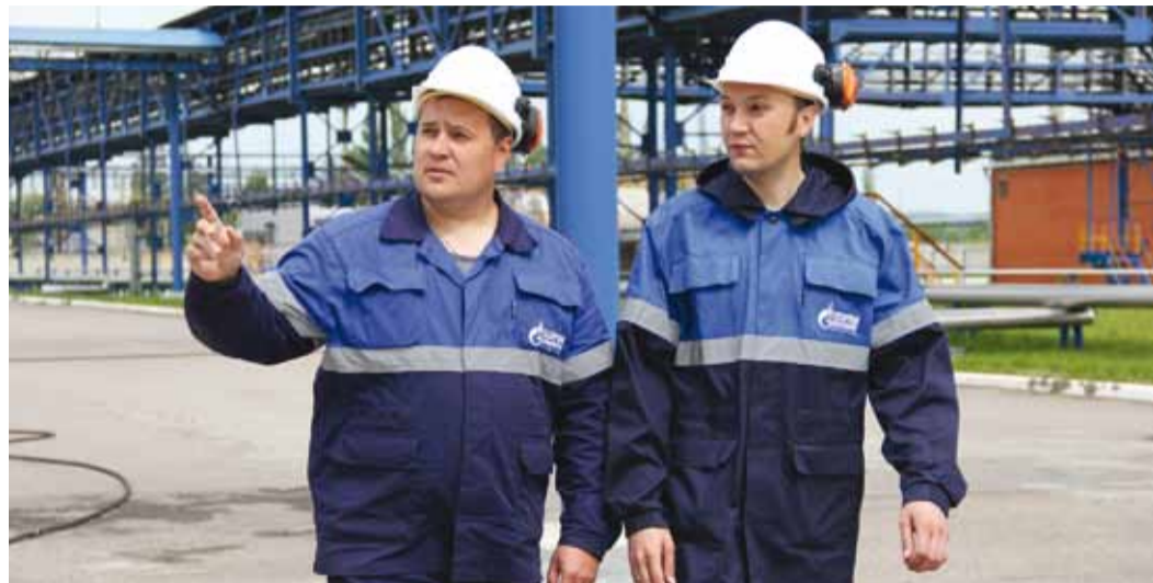
Быть представителем семьи газовиков – большая ответственность

Вы никогда не задумывались, какой смысл заложен в эту фразу? Согласно, наибольшее распространение она получила в среде военных. Однако если вдуматься, каждому из нас необходимо стремиться к тому, чтобы и мы могли с той же уверенностью и основанием повторить за сильными мужчинами с погонами на плечах: «Честь имею!».