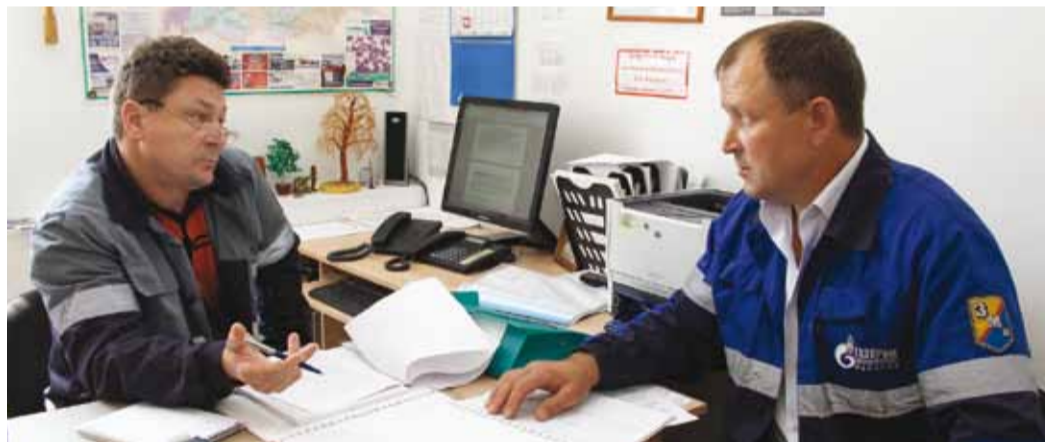
Система общечеловеческих ценностей – основа корпоративных отношений

То же можно сказать и про резко отрицательное отношение к любому коррупционному проявлению: думаю, для большинства такое отношение считается нормой, и хотелось бы видеть подобное понимание вопроса и у окружающих тебя коллег. О таких же пунктах, как запрет на