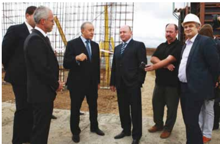
На строительной площадке ФОК «Газовик»