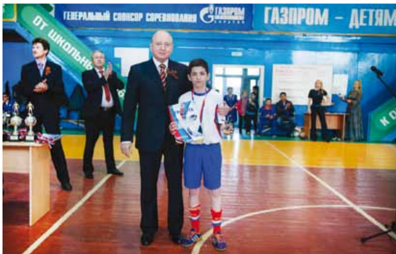
С юным спортсменом на турнире «Надежда Заволжья»

Мы участвуем во многих областных природоохранных и экологических проектах, в программах по внедрению энергосберегающих технологий и оборудования. Вместе с Саратовским техническим университетом ведем программы подготовки квалифицированных кадров, в том числе на базе Учебного центра предприятия. Совместно с Правительством области ведется работа по расширению рынка газомоторного топлива в регионе.