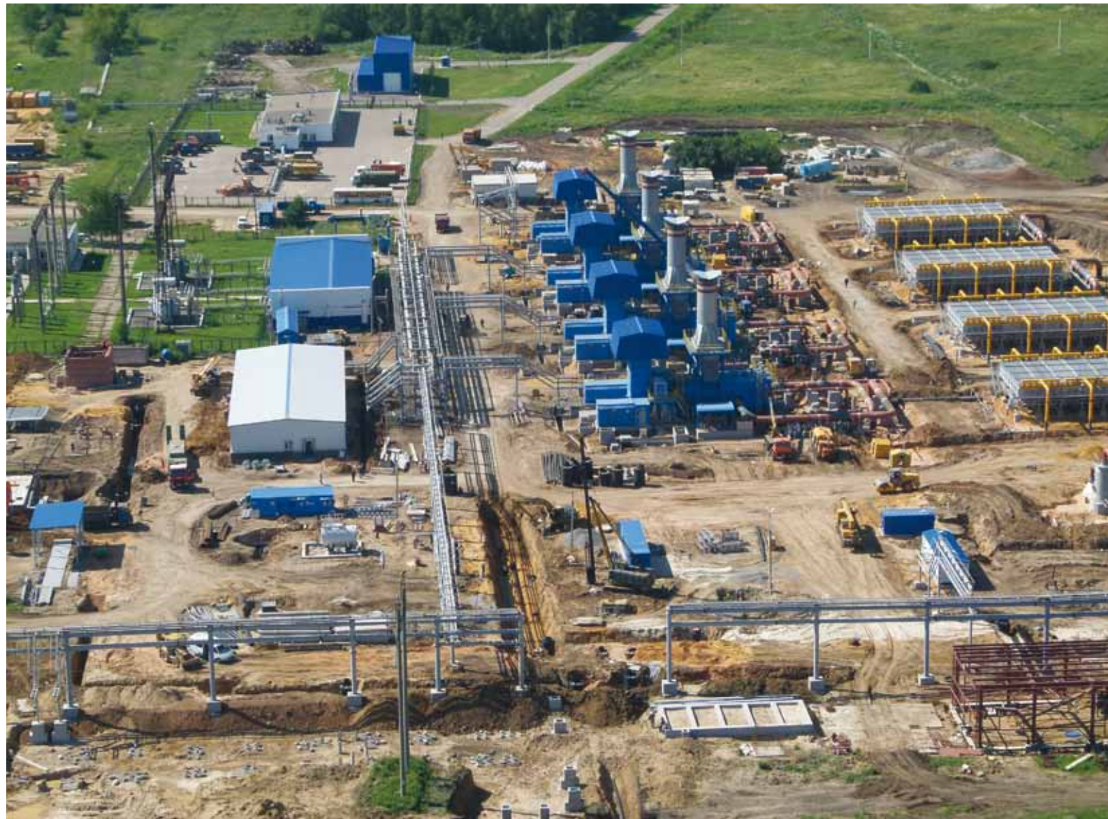
Так выглядела строительная площадка КС Екатериновка летом этого года

На заседании Правления ОАО «Газпром», которое состоялось 20 октября, были рассмотрены вопросы готовности объектов Единой системы газоснабжения (ЕСГ) к работе в период пиковых нагрузок осенью–зимой 2014–2015 годов и меры, необходимые для обеспечения в долгосрочной перспективе бесперебойного газоснабжения российских и зарубежных потребителей в зимний период.