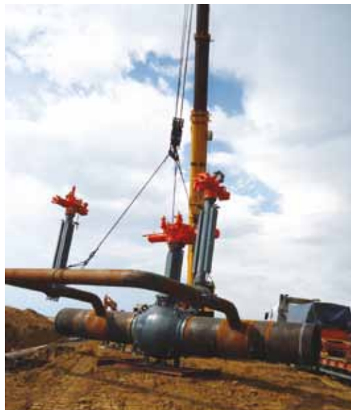
Замена дефектного крана на газопроводе «САЦ»

В прошлом году на газопроводах системы «САЦ» Мокроусского ЛПУМГ был выполнен большой объем внутритрубной дефектоскопии. Одна из главных задач этого года – устранение выявленных дефектов. Все отремонтированные участки – в общей сложности было устранено около 100 дефектов – введены в эксплуатацию в намеченный срок.