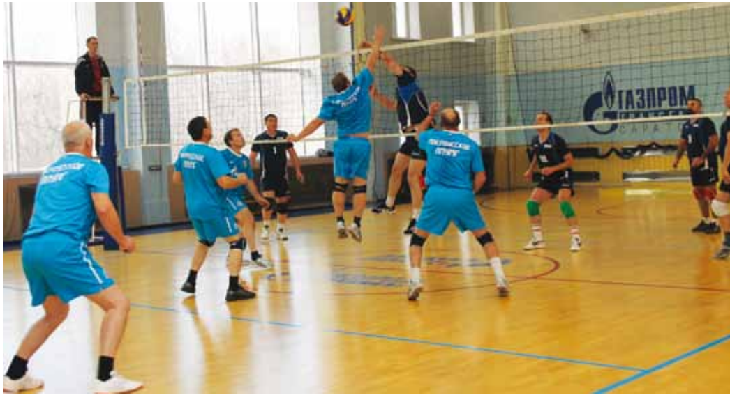
Мокроус и Сторожевка ведут спор за чемпионство

В волейбольном турнире Спартакиады среди ветеранов общества участвовало 12 команд. Четыре сильнейшие из них вели борьбу за призовые места.