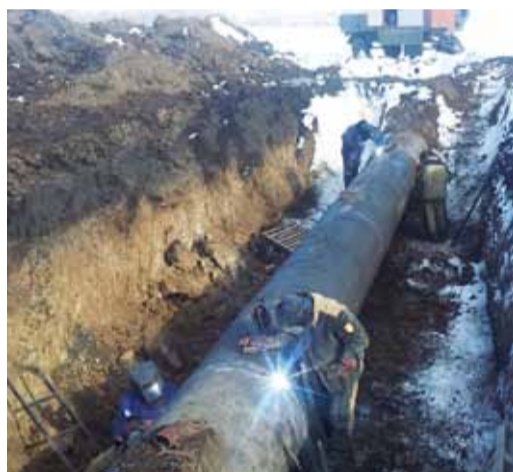
На газопроводе-отводе ГРС «Беково»