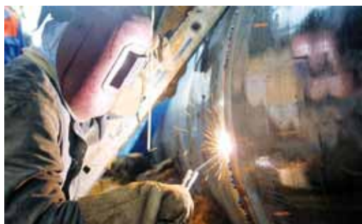
На трассе Петровского ЛПУМГ

- Нам завтра предстоит еще работа на другом газопроводе, - сказал начальник ЛЭС