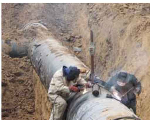
На трассе Мокроусского ЛПУМГ

На мой вопрос, как можно работать в таких условиях, руководивший работами начальник ЛЭС ответил: «Есть задача, и ее надо выполнить. А аварии, как известно, время года и суток не выбирают. Поэтому мы должны быть готовы к их устранению днем и ночью, в жару и стужу. На газовой трассе надо уметь работать при любой погоде, в любых обстоятельствах».