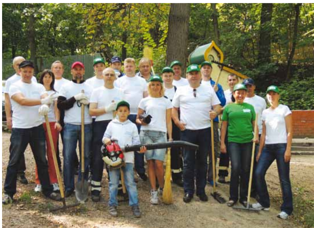
Уборка территории родника «Богатырский» завершена. Связисты отлично поработали

Служба по связям с общественностью и СМИ