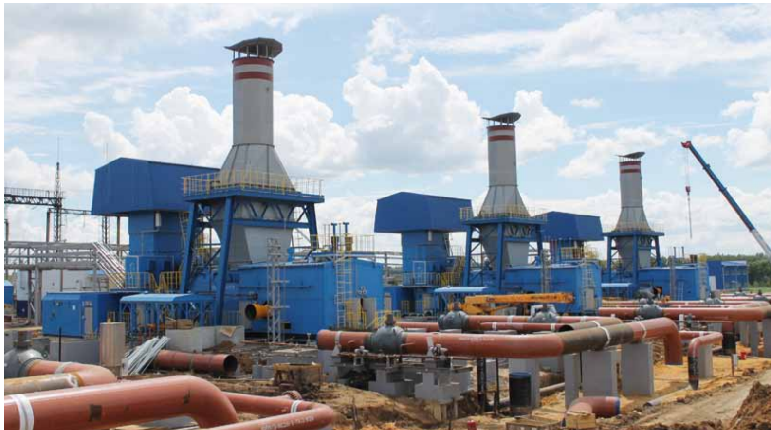
Строительство компрессорного цеха Екатериновского ЛПУМГ в самом разгаре