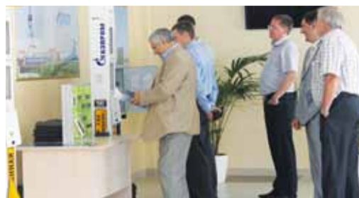
Знакомство с новым оборудованием ЭХЗ

На совещании также выступили начальники и специалисты служб филиалов, которые рассказали об итогах работы за 2013 год, о задачах этого года, об актуальных вопро-