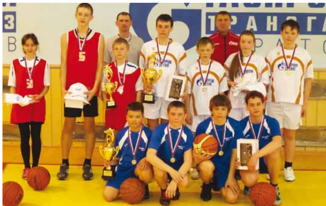
На переднем плане - «серебряная» команда стритболистов Мокроуса