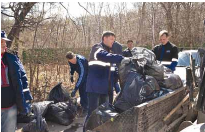
Мусор собран. Идет погрузка