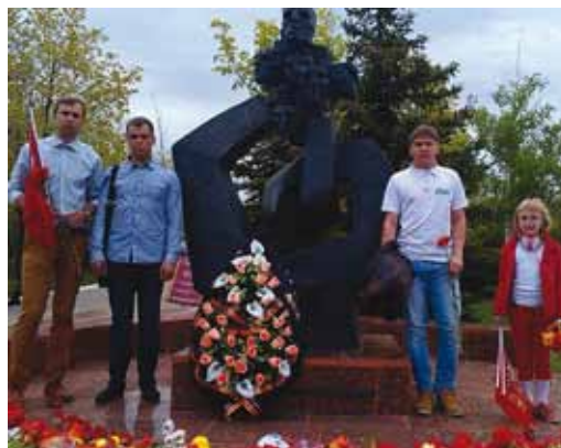
У памятника малолетним узникам

9 мая активисты молодежного объединения «Наше дело» Сторожевского ЛПУМГ и УМТСиК приняли участие в торжественном мероприятии по случаю празднования победы в Великой Отечественной войне, которое прошло в мемориальном комплексе «Парк победы» на Соколовой горе г. Саратова.