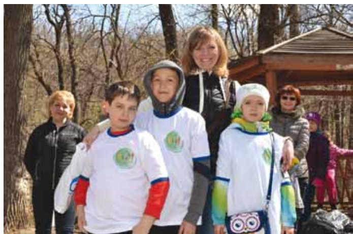
Победители конкурса по итогам субботника