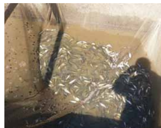
Еще минута, и рыбки поплывут в большой воде