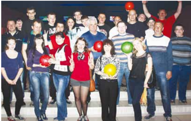
Боулинг приобретает все больше поклонников