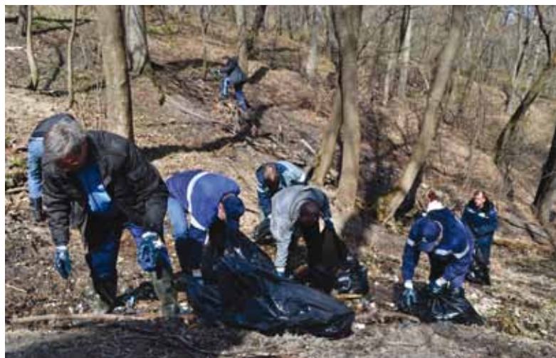
Так все начиналось на склонах оврага