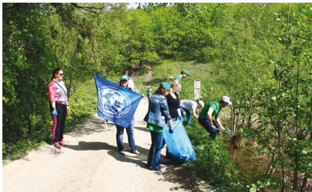
Андреевские пруды будут чистыми

Общество «Газпром трансгаз Саратов» не первый год сотрудничает с Русским географическим обществом. В прошлом году в номинации «Просвещение» Первой национальной премии в области географии, экологии, сохранения и популяризации природного и историко-культурного наследия России «Хрустальный компас» проект «Музей ООО «Газпром трансгаз Саратов»: с чего начинается Родина!» вышел в финал. 2014 год, объявленный ОАО «Газпром» Годом экологической культуры, в Обществе пройдет под эгидой экологического воспитания и культуры при взаимодействии с Русским географическим обществом. ■