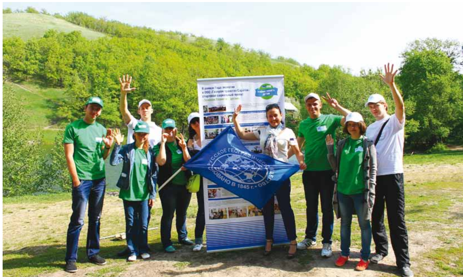
Представители Общества «Газпром трансгаз Саратов» - участники экологического фестиваля

13 мая состоялся областной экологический фестиваль «Сохраним природный парк «Кумысная поляна», в рамках которого были очищены берега Андреевских прудов, благоустроена территория Андреевских родников, вывезен мусор из леса.