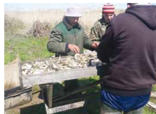
Проверка молоди перед выпуском