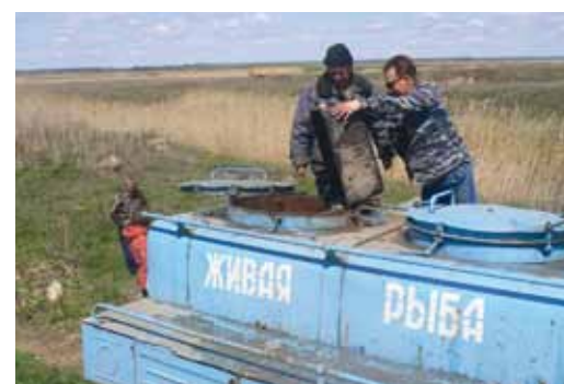
Рыба доставлена на место

В августе этого года будет произведен выпуск молоди стерляди в Волгоградское водохранилище в пределах Саратовской области в количестве около 130 тысяч штук. Акция будет проходить при участии Государственного научно-исследовательского института озерного и речного рыбного хозяйства. ■