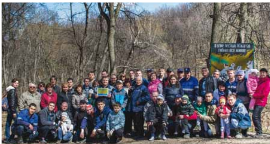
Все участники субботника. Фотография на память