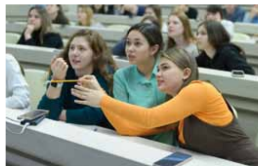
Риск - дело интеллектуальное

К слову сказать, размышлять над ответом приходилось на каждом вопросе. Например,