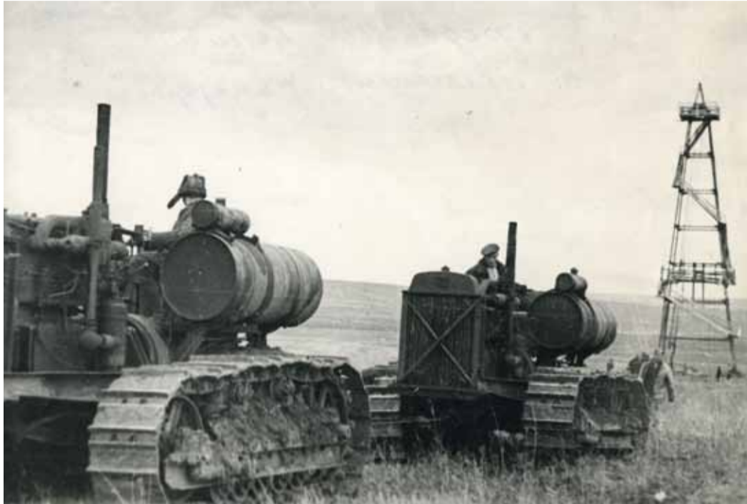
Перемещение вышки с помощью тракторов. Елишанское месторождение газа. 1942 г.

Что такое 55 лет? Это полвека и еще чуть-чуть. Это удивительный возраст для человека, который уже имеет за плечами жизненный и профессиональный опыт, который мудр, но в то же время молод. Что такое 55 лет для предприятия, особенно для предприятия с легендарной историей? Это километры газовых магистралей, это бесчисленное множество миллиардов кубических метров транспортируемого газа, это газификация тысяч населенных пунктов, это миллионы потребителей «голубого топлива», но главное – это самоотверженный труд и преданность любимому делу, это тысячи судеб работников и их семей, это история поколений.