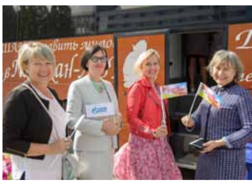
В донорской акции приняли участие более 100 работников